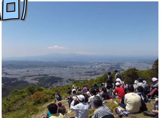
二ツ森山頂からの様子