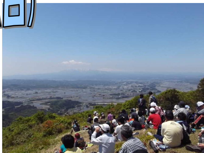
二ツ森山頂からの様子