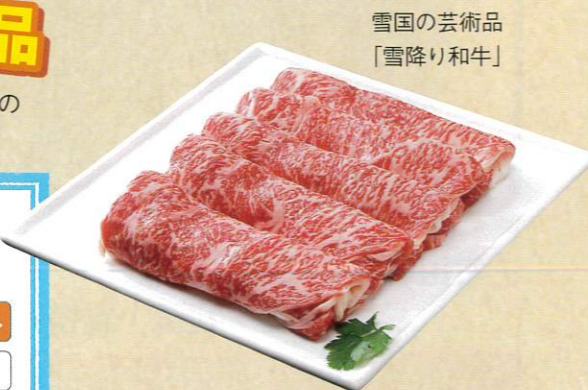
雪国の芸術品「雪降り和牛」