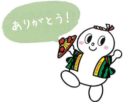
尾花沢市シンボルキャラクター「ゆきごろう」

事業実施にあたっては、事前に市民の皆様で構成されている「使途選定委員会」を開催しており、基金が有効に活用されるかどうかを審査しています。