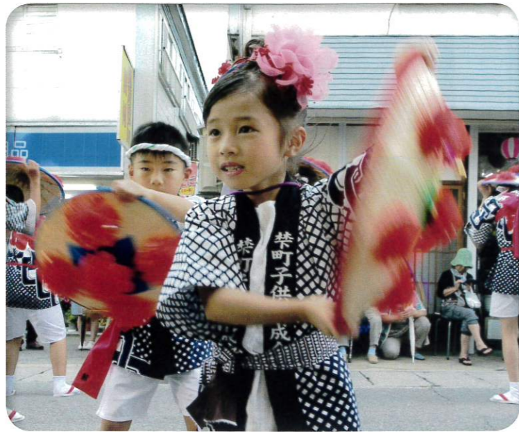
おばなざわ花笠まつり

県内の夏祭りの最後を飾る盛大な祭りです。初日は神輿や囃子屋台などの伝統行列、2日目の「花笠踊り大パレード」では、約2,500人の踊り手で街中が花笠一色に染まります。