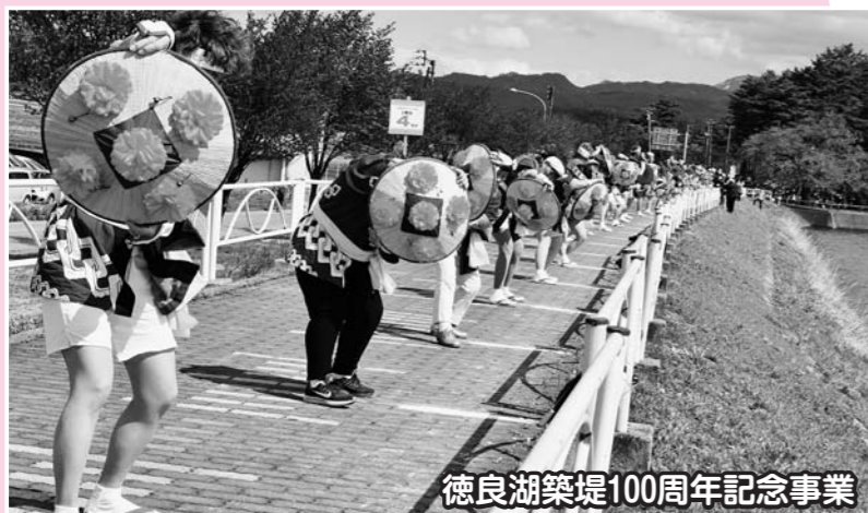
徳良湖築堤100周年記念事業