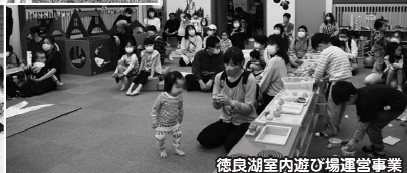
徳良湖室内遊び場運営事業