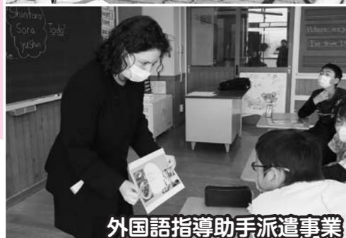
外国語指導助手派遣事業