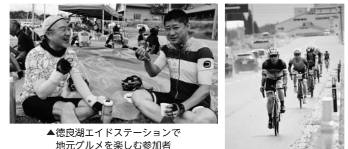
▲徳良湖エイドステーションで地元グルメを楽しむ参加者

宮城県加美町と尾花沢市・大石田町を結ぶ国道347号を自転車で駆け抜けるツール・ド・347が行われました。加美町から鍋越峠、347号沿いの集落を通過し、徳良湖経由であったまりランド深堀で折り返すロングコース(100km)には約200名が参加。徳良湖エイドステーションではアスパラ一本漬、くじらもち、スイカのペそら漬などの地元グルメに舌鼓を打ちつつ、懸命にペダルを踏みます。途中にわか雨が降るなど不安定な天候ではありましたが、参加者たちは初夏の風を肌で感じながらイベントを楽しんでいました。