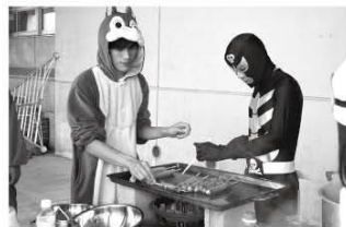
寄ってらっしゃい！見てらっしゃい！