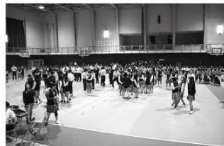
新企画「全校〇×クイズ」