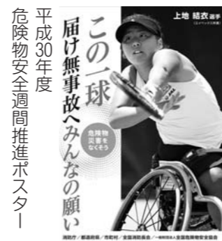
平成30年度 危険物安全週間推進ポスター

6月3日～9日は危険物安全週間です。灯油・ガソリン等の危険物の取り扱いに注意しましょう。 危険物事故を防ぐポイント ・子どもがさわらないように管理する。 ・高温になる場所に保管しない。 ・危険物の収納容器のふたを確実に閉める。 ・屋内で取り扱うときは、定期的に換気する。 ・火気の周囲で取り扱わない。 危険物安全週間推進標語 「この一球、届け無事故へみんなの願い」 「この一球、届け無事故へみんなの願い」 ☎消防本部 予防保安係 ☎ (22) 1 1 3 1