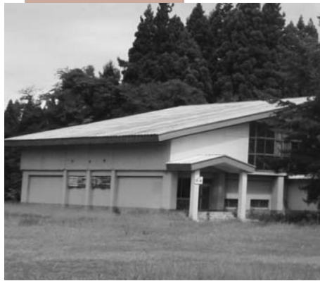
旧名木沢小学校体育館 地域の拠点として生まれ変わる