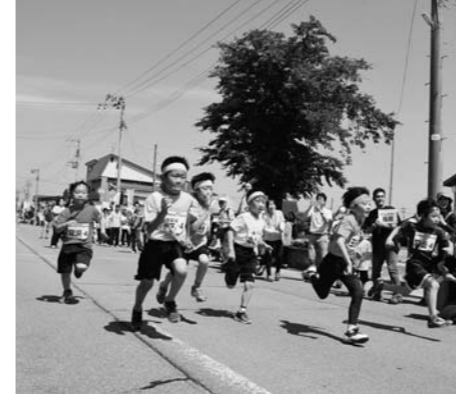
地域をつなぐ元気おばね絆駅伝