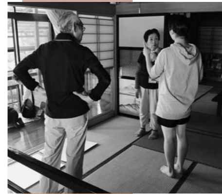
移住体験ツアーでの空き家見学 移住後の生活がイメージしやすいと好評