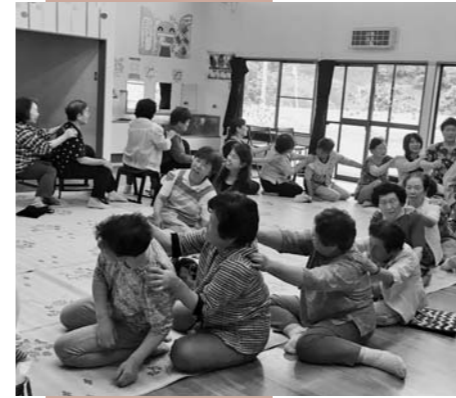
旧高橋保育園で開催されているおきな茶屋