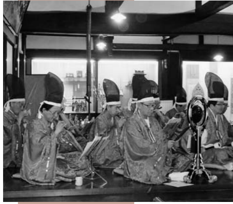
尾花沢雅楽の演奏 雅な雰囲気に包まれる