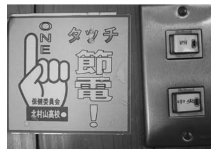
先輩の委員達が作った節電シール