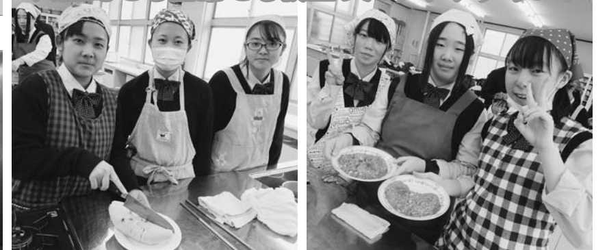
湯せんパン出来上がり!