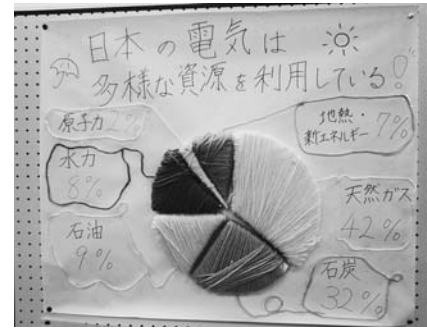
学園祭で発表した「日本の電気事情」

保健委員会は、各クラスから2人の計14人で活動しています。今年度は、「電気と節電」について重点的に取り組んでいます。北村山高校では、冬に電気使用量が多くなります。限りある電気を無駄にしないように、「教室やトイレは最後に出る人が電気を消す」「暖房が入っている教室の扉を開けっぱなしにしない」ということを全校生徒一人一人が心掛けるように取り組みをしています。 北村山地区の高校の保健委員が集まったリーダー研修会では、「災害時でも日常でも役立つバッククッキング」の講話をお聞きして、実際に調理実習をしました。 これからは風邪やインフルエンザが流行する時期です。手洗い、うがい、換気などで予防できるように、保健委員会は広報活動していきます。