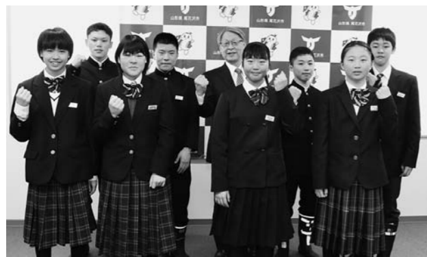
生徒たちは「東北・全国大会でも頑張ります」と決意を新たにしました。

第59回山形県中学校総合体育大会スキー競技大会に出場し、東北・全国大会への出場が決まった生徒たちが、1月20日に菅根市長を訪れました。