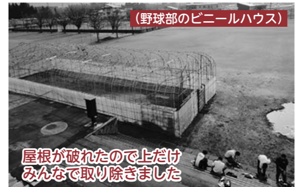
(野球部のビニールハウス)

今年には気候変動が激しく、去年に比べると段違いの雪の少なさでした。例年であれば雪でいっぱいのはずの自転車小屋駐車場や、雪で埋まって地面が見えず使えないはずのグラウンドやハンドボールコート。数年前まで、卒業式の前にブルドーザーで除雪していた道路側の駐車場。今年には地面が丸見えです。さらに、春の嵐なのか強風で野球部のビニールハウスの屋根が破れてしまいました。 筆者は、農作物などに大きな影響があるかもしれないと家族が話しているのを聞きました。それに加えて、国内では、新型コロナウイルス感染症が猛威を振るっており、日々状況が変化しています。基本的な感染症対策（手洗いや咳エチケットなど）を徹底し、体調管理をしっかりと心がけたいと思います。 今年度もこの「きた☆スター」をお読みいただきありがとうございます。来年度も内容をよりよいものにしていきたいと思っております。よろしくお願いいたします。 【きた☆スター】に関するご意見・ご要望等ありましたら ☎(23)2785までお寄せください。】