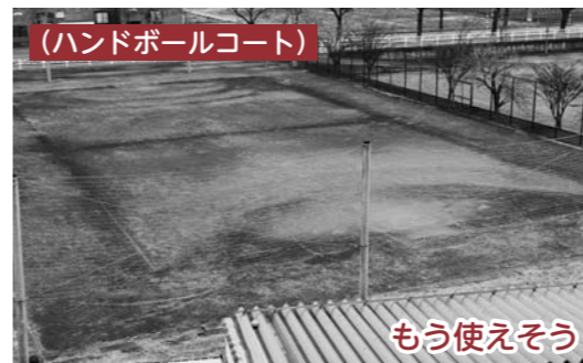
(ハンドボールコート)