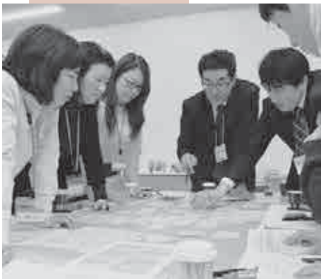
第7次総合振興計画策定に向け開催されている市民ワークショップ。活発に意見が出される。