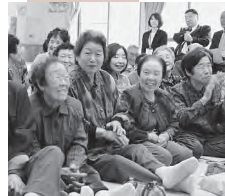
宮沢地区地域福祉交流センターで行われているおきな茶屋。笑顔が絶えない。

みんながいつまでも元気に暮らせるよう、地域の活性化、交通支援等を行います。移住定住者を増やすための施策をすすめます。