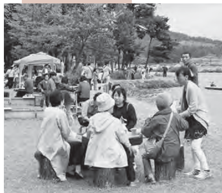
徳良湖畔で開催されるドツキ市。絶好のロケーションで多くの人が集う。

市民憩いの徳良湖周辺の整備、市特産品や市内企業のPRを行い活力あるまちづくりを進めます。