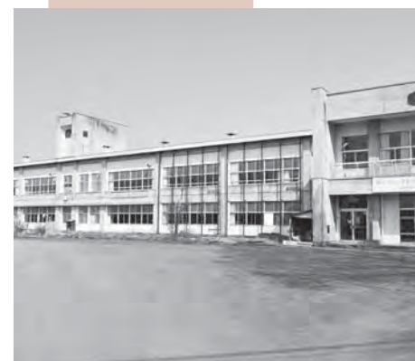
解体後、除雪基地が建設される旧明德小学校校舎。