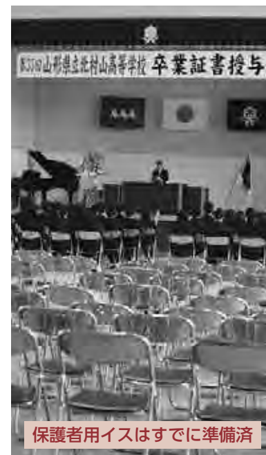
保護者用イスはすでに準備済

3月1日に卒業証書授与式を挙行了しました。卒業生と職員、生徒会長、来賓はPTA会長だけの式でした。それでも、心を込めて式を行いました。卒業の喜びよりは、去っていくさみしさが強く感じられる卒業式でした。また、卒業生の未来にどうか幸多かれと、願わずにいられない気持ちになりました。