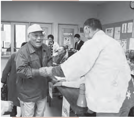
プレミアム商品券の販売には多くの市民が訪れる。