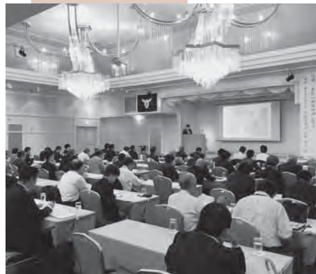
取引先拡大につながる企業セミナー。