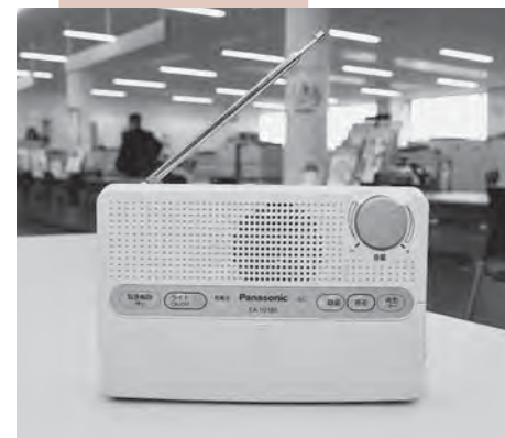
各地区に貸与する防災行政無線個別受信機。情報伝達の強化を図る。

防災行政無線や消防資機材の機能強化で市民生活の安全安心を守ります。危険な状態にあるブロック塀等の撤去を促進します。