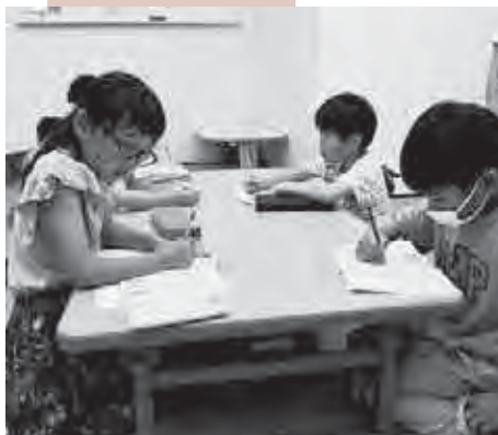
放課後児童クラブでの子どもたち。集中して宿題に取り組む。