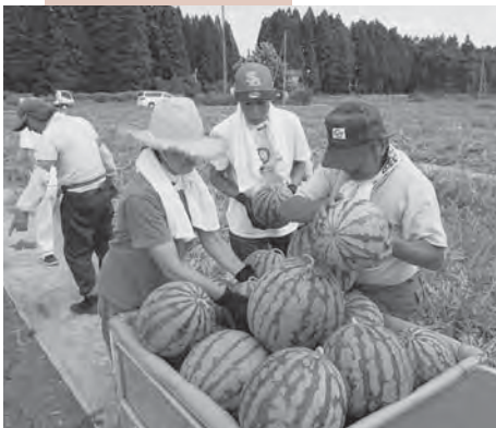
新規就農を視野に入れ農業体験を行う参加者。