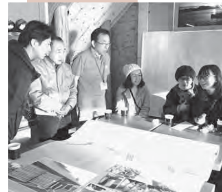
今年2月に行われた移住体験ツアー。本市での生活がイメージできると好評。