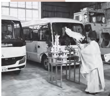
昨年度に購入したスクールバス。遠距離通学の安全を確保。

病児病後児保育を実施し、子どもたちの健やかな成長を支援します。 小中学校の学習環境を向上します。