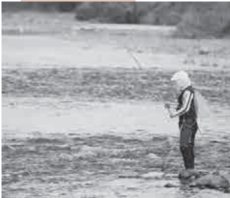
きれいなふるさとにはきれいな水が欠かせない。