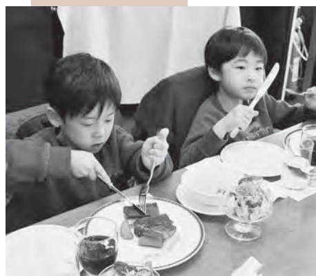
地産地消給食で提供された尾花沢牛。口に含むと自然と笑みがこぼれる。