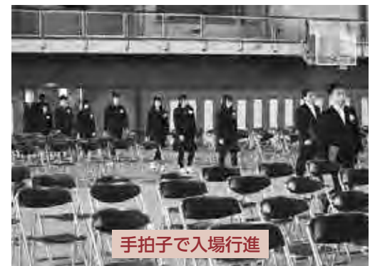
手拍子で入場行進