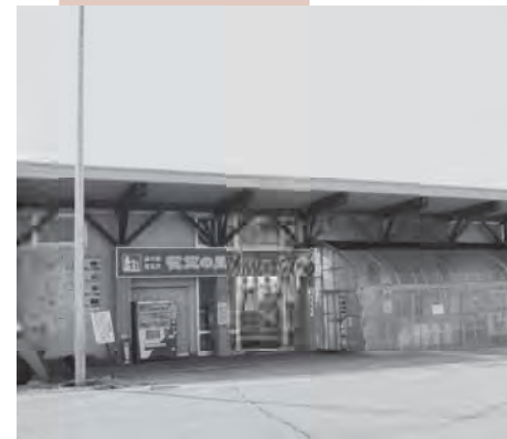
リニューアルされる道の駅「ねまる」。