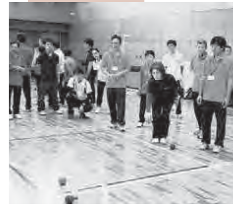
ボッチャは目標球めがけボールを放ち、いかに目標球に近づけるかを競う競技。