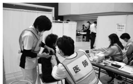
▲ワクチン接種のシミュレーションの様子 (3月17日)

基礎疾患のある方・薬を飲んでいる方・ワクチン接種に不安のある方へ 接種する前にかかりつけ医に相談しましょう！