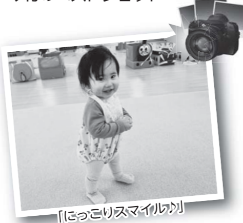
「はっぴースマイル」