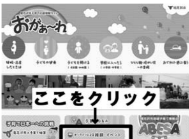
▲「オンラインによる相談・イベント」よりご利用ください。