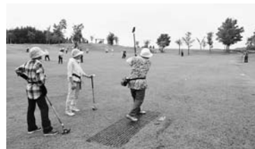
▲福原地区グラウンドゴルフ大会