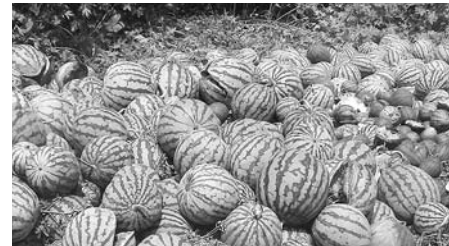
▲山に放置されたスイカ

野生鳥獣への餌付けをしていることとなり、人慣れと鳥獣の増加にも繋がってしまいます。