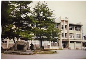
尾花沢小学校 (尾花沢代官所跡)