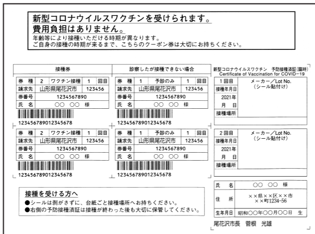
▲開封すると接種券がでてきます