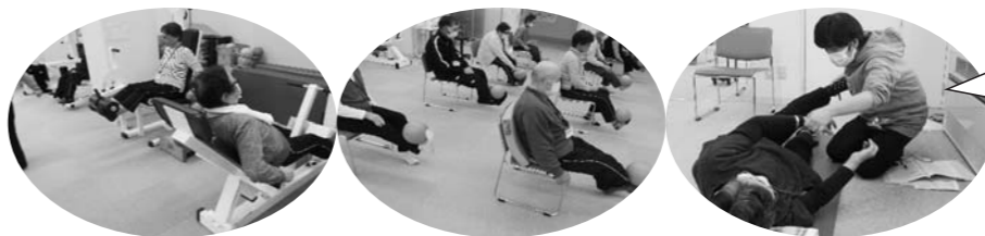
リハビリ専門職に足腰や関節の悩みを相談

足腰を楽にして、これからも元気に過ごせるように、 この機会に専門スタッフとトレーニングをしてみませんか!?