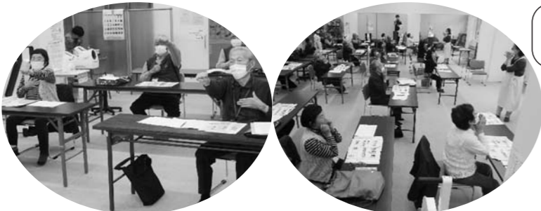
教室の初回と終了時で、脳の記憶力などの変化をチェック！（左が初回、右が終了時）