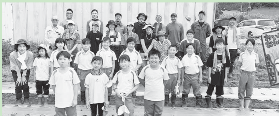
▲今年も地域の皆さんにご協力をいただきました!