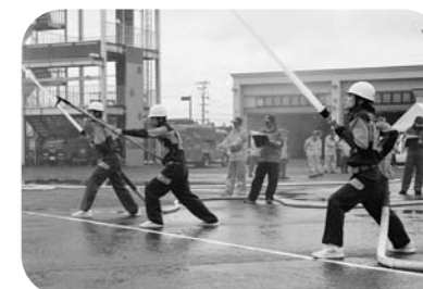
▲消防団の活動の様子