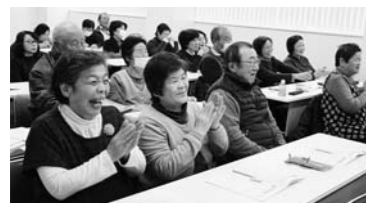
▲毎年大好評の脳トレ塾の様子