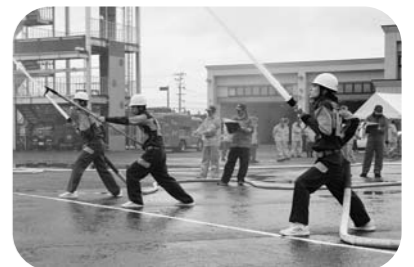
▲消防団の活動の様子