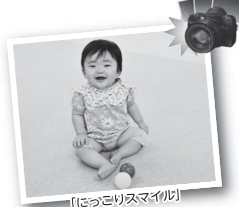
[[ほっこりスマイル]]