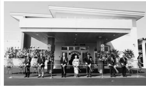
落成式でのオープンセレモニー(テープカット)