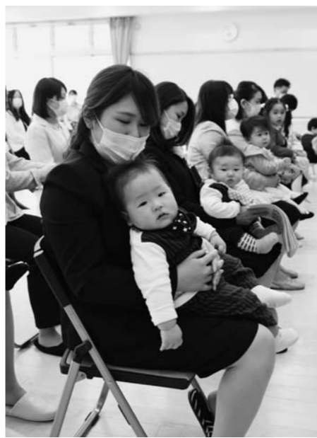
入園式に出席する新入園児と保護者たち

新しい園舎は鉄骨造り2階建てで床面積が1,817.96㎡。保育室、遊戯室のほか、外から直接出入できる専用玄関を備えた子育て支援センターの部屋も確保され、保育機能が充実されました。また、待望の運動会ができる園庭も整備され、子どもたちが広々としたスペースで元気に生活できる造りとなっています。落成式後は入園式が行われました。新型コロナウイルス感染症防止対策のため、在園児は出席せず、規模を縮小しての式となりましたが、0歳児から5歳児まで計21人の新入園児たちは、快晴の中保護者と一緒に登園。式では自分の名前が呼ばれると元気に返事をしていました。 広くて明るい園舎で、お友達と思いっきりあそんで毎日楽しく過ごしてくださいね！