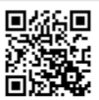
▲議会中継はこちらから。

一般質問項目チラシ配布・掲載場所 庁舎1階市民サロン・各地区公民館・悠美館・市公式HP