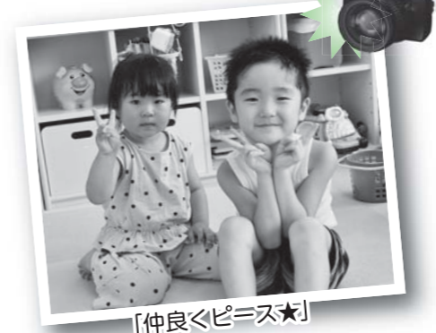
※ABESA・子育て支援センターは、感染症防止対策をしっかりと行いながら運営しています。