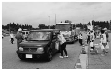
▲「ふるさと笑顔帰省作戦」の様子