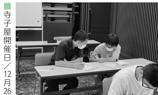
▲尾花沢寺子屋「夏の陣」の様子

寺子屋開催日／12月26日 市教育委員会では、中学生を対象とした学習会「尾花沢寺子屋」を実施しています。この寺子屋で中学生の頑張りを支えてくれる高校生サポーターを募集します。 サポーター登録をすると、寺子屋情報が届きますので、都合が合う場合に、協力をお願いする仕組みです。 教えることに興味がある方と一緒に勉強したい方は、下記QRコードから登録をお願いします。