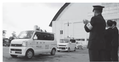
▲青パトが防犯パトロールに出発!