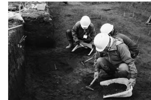
▲「原の内A遺跡」発掘調査の様子

バスで送迎します。 定員／先着20人 申込期限／11月10日(木) ※左記までお申し込みください。 ☎ 社会教育課 文化財係 【内線31】