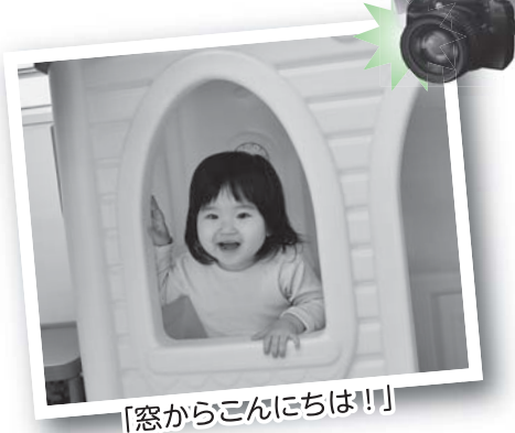
「窓からこんにちは!!」

※ABESA・子育て支援センターは、感染症防止対策をしっかり行いながら運営しています。