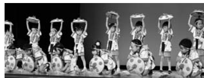
▲尾花沢幼稚園によるオープニングセレモニー

初日の11日には、サルナートで青パトの出発式が行われ、オープニングセレモニーでは尾花沢幼稚園の年長組24人が花笠踊りを披露。式終了後、青パトが一斉に防犯パトロールに向かいました。