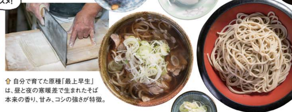
自分で育てた原種「最上早生」は、昼と夜の寒暖差で生まれたそば本来の香り、甘み、コシの強さが特徴。