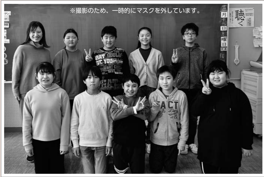
※撮影のため、一時的にマスクを外しています。