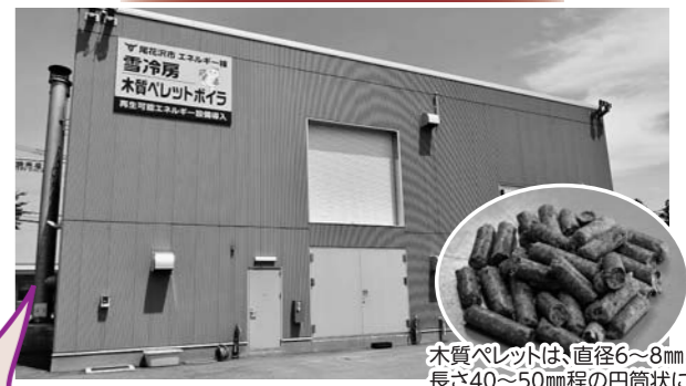
木質ペレットは、直径6～8mm、長さ40～50mm程の円筒状に木材を加工したものです。

市役所西側駐車場に建つエネルギー棟には、巨大な木質ペレットのサイロとボイラが設置されています。木質ペレットは間伐材などを加工してできた燃料で、森林資源の有効活用や森林保護にも役立つ環境にやさしいエネルギー。これを庁舎の暖房に使用しています。また災害時には72時間暖房機能が保てるよう、灯油ボイラも併設して備えています。 厳しい寒さが続くこの季節、市役所を訪れた際は、クリーンエネルギーの空調の暖かさを感じてみてはいかがでしょうか。