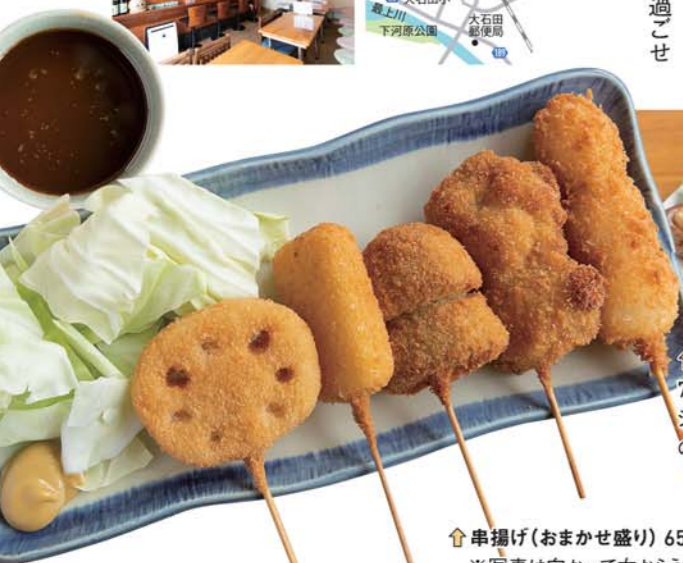
串揚げ(おまかせ盛り) 650円/看板メニュー串揚げの人気アイテム5点盛り合わせしたお得な一皿。 ※写真は向かって右からうづら・ほたて・しいたけ・チーズ・れんこん

大石田駅そばにある「おさえ屋もくれん」は、今日も気さくな店主とお客さんの明るい声が響きます。お店の名前にある「おさえ」は方言で「かすのこと。『今日のおかず何?』と、気軽にいいものを食べに来てほしいという気持ちで込められています。お店の看板メニューの串揚げは、細かくしたパン粉を使い注文を受けてから揚げる串揚げに自家製の揚げだれは相性抜群でおかわりしたくなる味。他にも「おさえ」とお酒のメニューが豊富で、お腹も心も元気をもらえるような、素敵なお店を過ごせそうです。