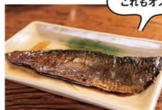
にしん 400円/丁寧に煮込まれたにしんは、照りが出て柔らかく絶品。