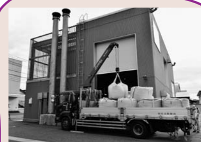
▲ペレット搬入の様子。