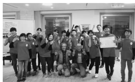
▲先輩から受け継いだこれまでの活動や、工夫を詰め込んだ発表が大賞受賞につながり「ひたすらにうれしかった」と喜ぶ5・6年生たち。

現中学1・2年生が始めた「さわのはな広め隊」を受け継ぎ、活動を続けている宮沢小学校5・6年生13人。米づくりを体験したり、修学旅行先で出会った人々にお米を配ったりするなど、知識を深めるとともに、多くの人に知ってもらうための活動にもクラス一丸となって取り組んできました。 味が良く、元々は県の主力品種でしたが、米の見目が悪いことや収穫量が少ないことから平成9年に県の奨励品種から外され、「幻の米」と呼ばれる「さわのはな」。子どもたちは、生産者の方から教わった「見た目でなく、中身で判断してほしい」という思いや、「さわのはな」の歴史、魅力を7分間という限られた時間でプレゼンするため、どうしたら最大限に伝えられるか、試行錯誤しながらスライドと発表原稿をまとめました。 「幻の米を、もっとみんなに知ってもらいたい」という熱い気持ちと、興味をもって積極的に調べたことを、自分たちの言葉で聞き手に分かりやすく伝えたい発表が高く評価されました。