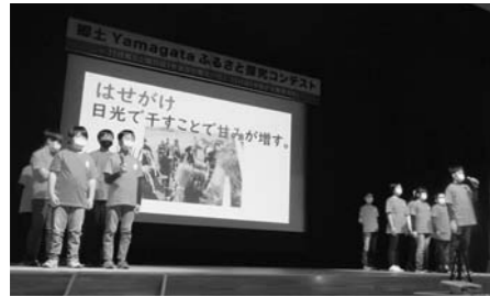
▲7分間にまとめるよう、特に伝えたいことを厳選し、授業だけでなく自主的にも集まって何度も練習。自信をもってコンテストに挑み、堂々と発表しました。

11月23日、遊学館を会場に、山形県教育委員会主催の「郷土Yamagataふるさと探究コンテスト」の最終審査会が開催され、宮沢小学校5・6年複式学級の「さわのはな」についての発表が大賞を受賞しました。