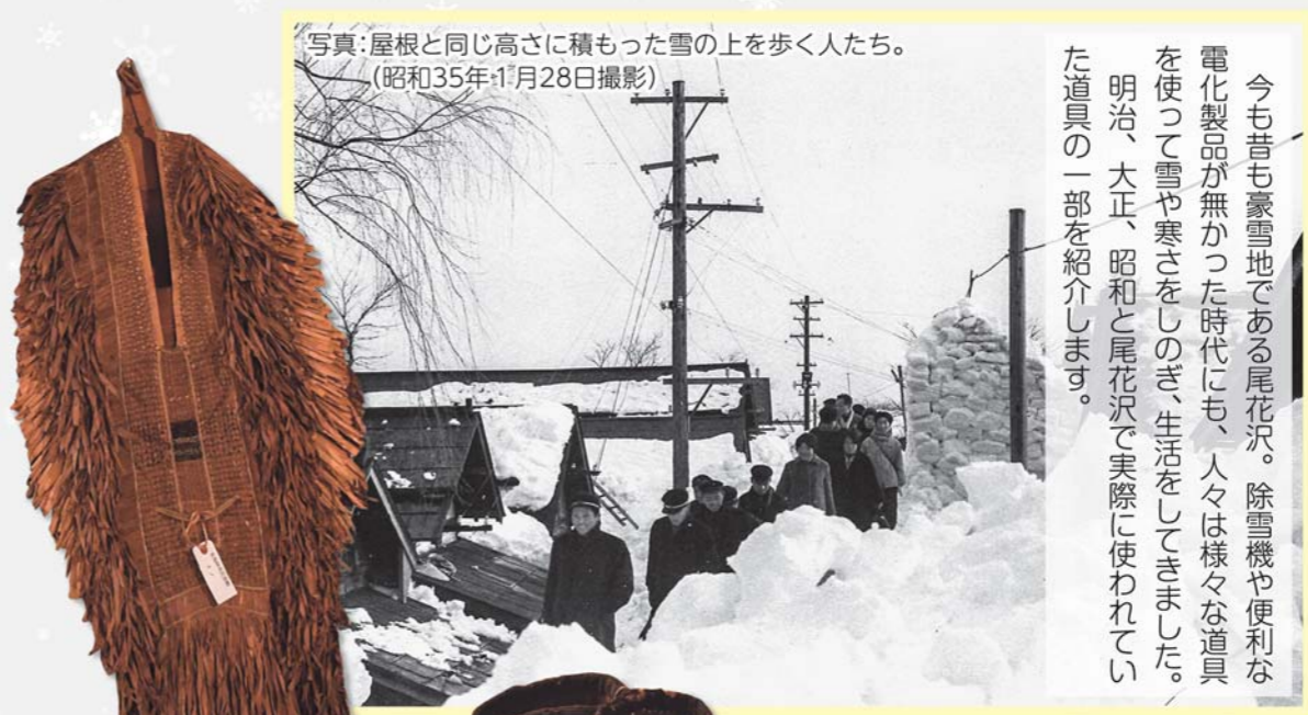
写真：屋根と同じ高さに積もった雪の上を歩く人たち。 (昭和35年1月28日撮影)

今も昔も豪雪地である尾花沢。除雪機や便利な電化製品が無かった時代にも、人々は様々な道具を使って雪や寒さをしのぎ、生活をしてきました。明治、大正、昭和と尾花沢で実際に使われていた道具の一部を紹介します。