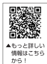
▲もっと詳しい情報はこちらから！

家庭の電気使用量は、「エアコン」「冷蔵庫」「照明」で5割以上を占めています。家庭での節電では、これらの家電の省エネが大きなポイントになります。家電の省エネ化は毎年進んでおり、古い家電を使い続ける方がかえって「もったいない」場合もあります。自宅の電化製品を見直し、省エネ家電に切り替えるなど、電気代の節約に取り組んでみませんか。