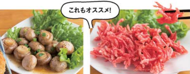
舟形マッシュルームのバター焼き 750円/肉厚で味も濃厚な舟形マッシュルームにバターしょうゆと白ワインの酸味が合わさって、お酒が進みます。 合はしょう天 600円/見た目も華やかな紅しょうがの天ぷら。酸味とピリッとした辛みがお酒との相性ピッタリ!