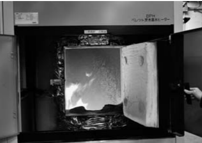
▲燃焼後の灰が少ないため廃棄物の発生を抑制するというメリットもあります。