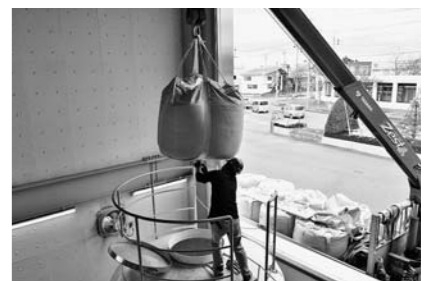
▲エネルギー棟のシャッターを開け、1袋500kgのペレットをクレーンで吊るし、タンクの上から補充します。