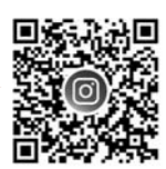
尾花沢市地域おこし協力隊 Instagram

市内の風景や出来事などを、3人の隊員たちの目線で紹介。ぜひのぞいてみてください!