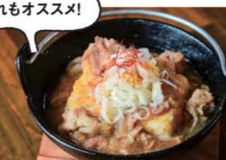
合揚げだし肉豆腐 550円 / 玉ねぎを溶けるぐらいまで煮込んだ煮汁が揚げ出し豆腐に「しみ旨」でお酒が進みます。