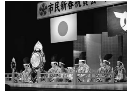
▲「越天楽」の曲で、新春にふさわしい音色を披露した尾花沢雅楽楽人会の皆さん。