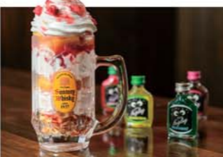
合じょっきのばふえ 880円 / ジョッキグラスの中にいちごやアイス、生クリームがたっぷり入った居酒屋らしいスイーツ。