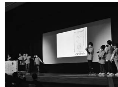
▲幻の米「さわのはな」の学びの成果を堂々と発表した、宮沢小学校5・6年生の児童たち。