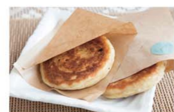
合あんバターホットク 250円 / おやきのような韓国定番屋台スイーツ。餅粉入りのモチモチしたパン生地にあんバターがマッチ。できたてをほおばりたい!