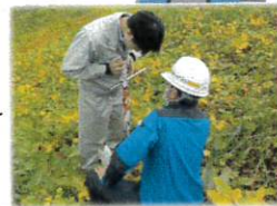
←貫入棒を使い、地盤の緩みがないか、のり面の状態を確認しています。