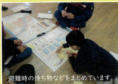
避難時の持ち物などをまとめています。