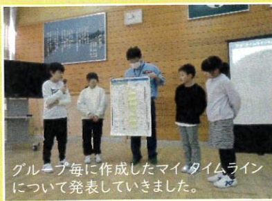
グループ毎に作成したマイ・タイムラインについて発表していきました。

各地区ごとに5つのグループをつくり、国土交通省が推奨している「逃げキッド」を使ってマイ・タイムラインを作成していきました。生徒の皆さんは、あらかじめ避難先や避難時の持ち物を調べており、それを基にグループ毎にいつ、何をすべきか等をまとめ、発表していきました。