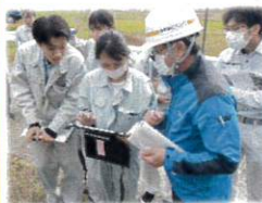
↑実際にタブレットを使って不法投棄を発見したときの報告をしています。

若手職員の育成プログラムの一環として入省1～4年目の事務系職員を対象とした勉強会を行いました。当日は山形県内の若手職員が大石田出張所管内の排水樋管を見学したり、河川巡視体験を行うなど河川管理の重要性や出張所の業務内容について学びました。