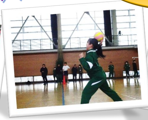
2年生 ドッジボール