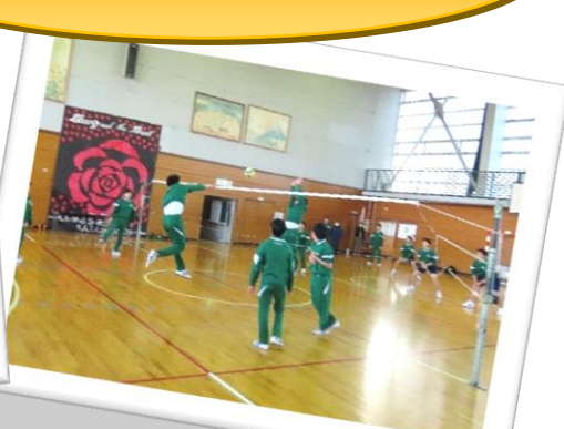
3年生 バレーボール