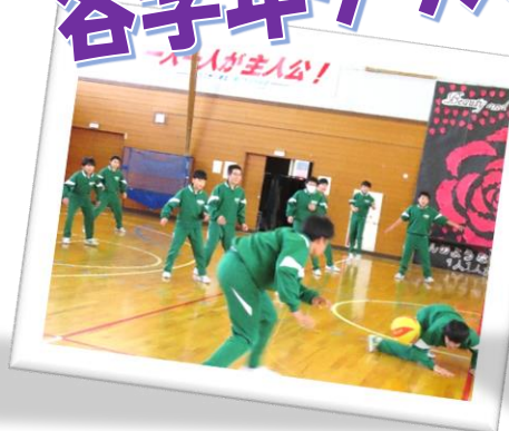
1年生 ドッジボール