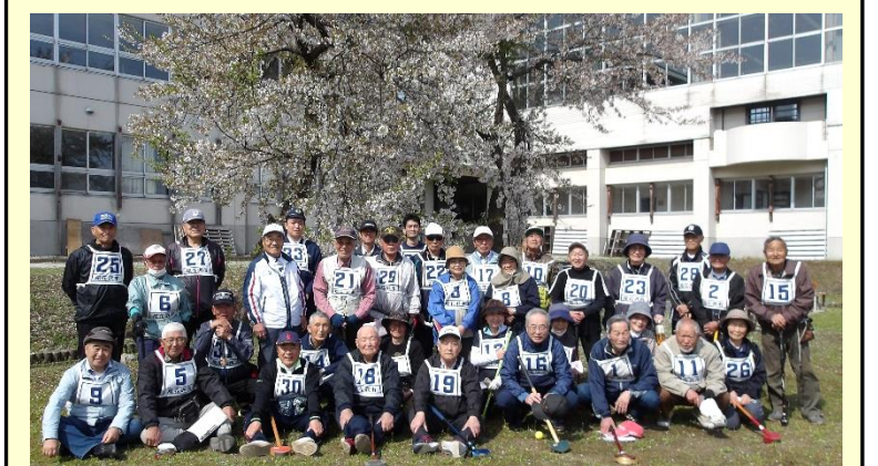
ホールインワン賞