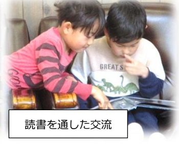
読書を通じた交流