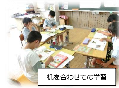
机を合わせた学習

宮沢小学校の校内研究テーマが「読むこと」を対象にしたものになっており、国語の教科書の資料を学習する前に、資料内容や作者と関連する本に触れさせることで、児童の主体的な学びを引き出しています。