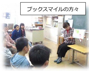
ブックスマイルの方々

月に1回、先生方や地域ボランティア「ブックスマイル」の方々から、様々な分野の本を読み聞かせしていただいています。児童会の図書委員会を中心に、上学年の児童が下学年の児童への読み聞かせ会も行っています。