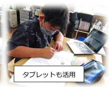
タブレットも活用

「本は心の肥やし」です。ICTやSNS全盛の時代だからこそ、本を手にとってじっくり本の世界に浸る時間を大切にしてみませんか？