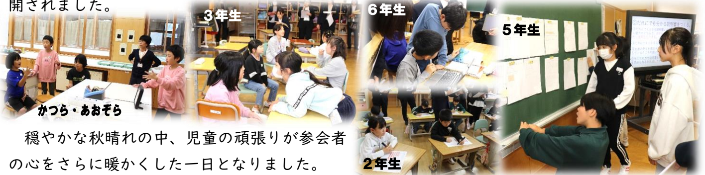
かつら・あおぞら

当日は、上記の視点を取り入れた授業を通して、主体的に学ぶ子供の育成を目指した授業が展開されました。