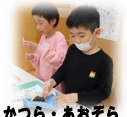
かつら・あおぞら