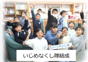
いじめなくし隊結成