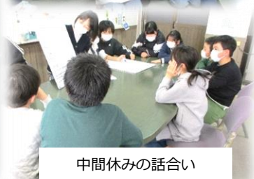
中間休みの話し合い

「いじめなくし隊」は、昨年10月の校長講話で与えられたテーマ「①いじめられた人、いじめた人の気持ち、②いじめが起きないようにするための取組」を、子供たちが真剣に話し合う中で発足しました。入隊は自由で、1年生から6年生まで総勢17名で組織されました。「いじめなくし隊」が目指す学校は「 なかよしながっこう 」「 たのしいがっこう 」「 べんきょうがわかるがっこう 」です。