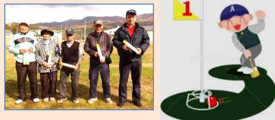
(▼下/総合成績入賞者、▲上/ホールインワン達成者)