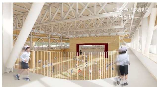
完成予想内観図 体育館棟