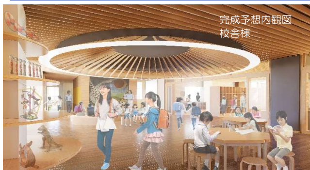
完成予想内観図 校舎棟

近隣の皆さまや付近を通行の皆さまには、工事期間中何かとご不便をお掛けする事と思いますが、工事中は安全を最優先に作業を進めていきますので、ご理解とご協力をお願い致します。