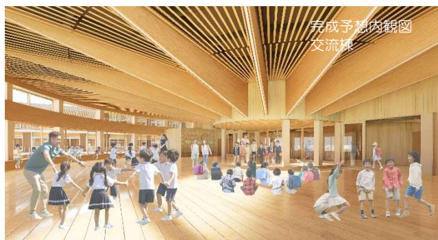
完成予想内観図 交流棟