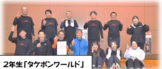
2年生「タケポンワールド」