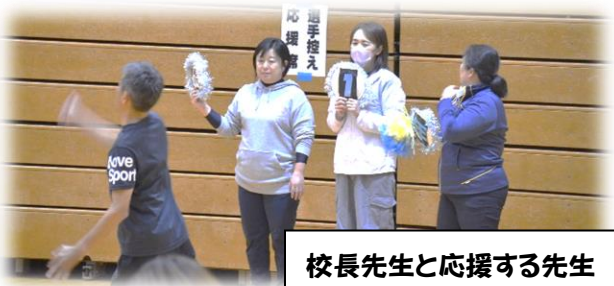
校長先生と応援する先生