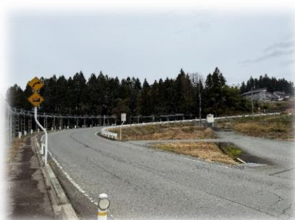
① 行沢橋付近の上り坂