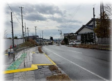
② 大石田中付近の下り坂

実際に行ってみて歩いてみないと分からないのでしょうか。もし、実際に歩いたとして、何を基準にして比べることができるのでしょうか。疲れ具合？心拍数？