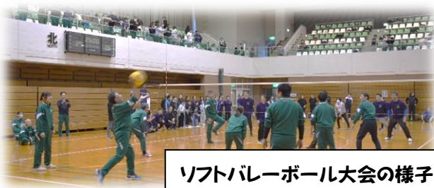
ソフトバレーボール大会の様子