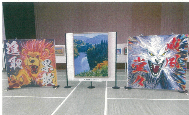
尾中運動会看板・絵画「ダム」の秋