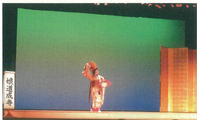
正派若柳流延弥会