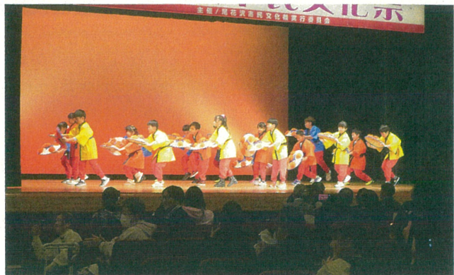
尾小4年生による花笠踊り5流派披露