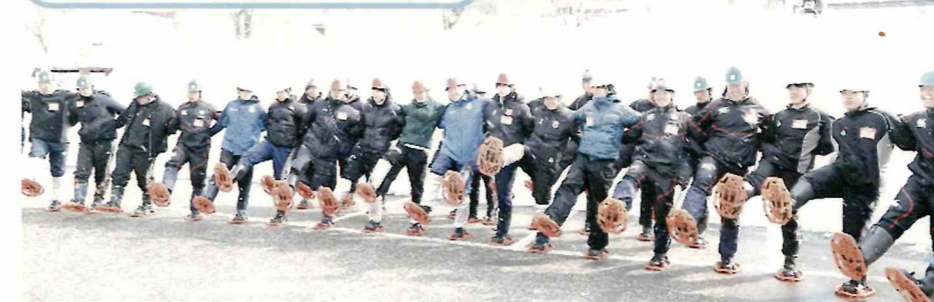
令和8年2月12日 尾花沢市・大石田町広域連携推進協議会と東北学院大学