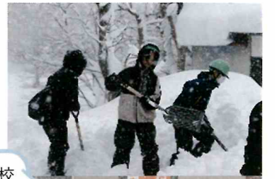
令和8年1月30日 福原中学校