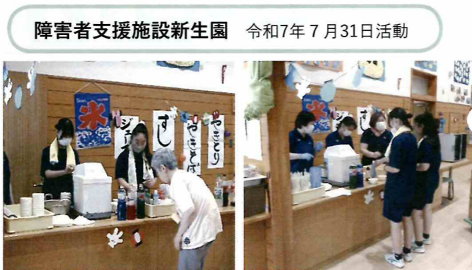
障害者支援施設新生園 令和7年7月31日活動