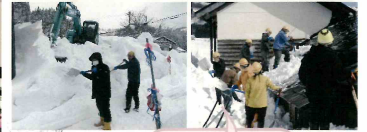
令和8年2月9日・10日 大山建設株式会社