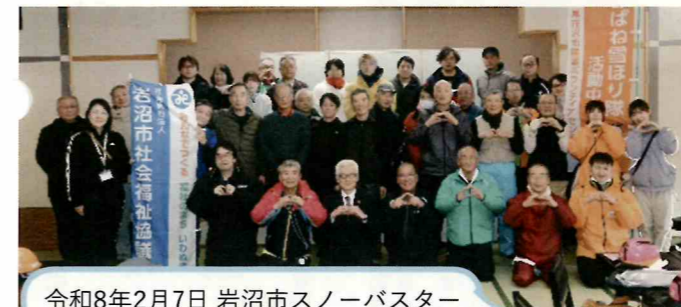
令和8年2月7日 岩沼市スノーバスター