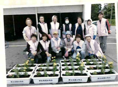
高齢者施設へのプランター寄贈