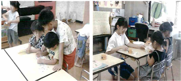
ひまわり保育園 令和7年8月4日、5日活動