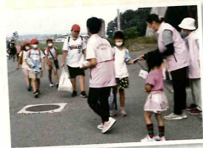
小学校であいさつ運動とティッシュ配り

更生保護女性会は、罪を犯した人や非行のある少年達の立ち直りに協力する事を目的とした法務省管轄のボランティア団体で、社会を明るくする各種活動に取り組んでいます。