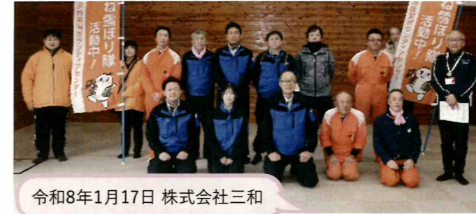
令和8年1月17日 株式会社三和