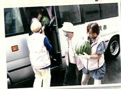
更生施設へのスイカ訪問