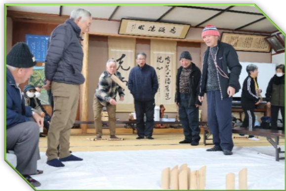
【常盤地区】モルック教室(2～3月)