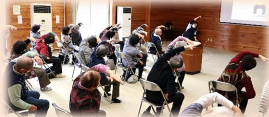
【100歳体操】(写真：いきいき100歳体操スペシャルデー)