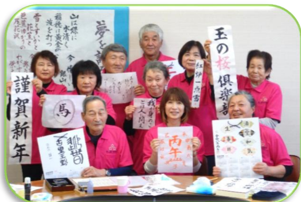
【玉野地区】玉の桜倶楽部(11月)

【生活支援コーディネーター活動記録】～昨年11月以降でお邪魔した活動の一部です！～