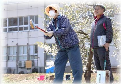
【玉野地区】グラウンドゴルフ打ちはじめ大会(4月)