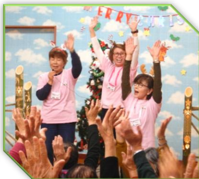
【宮沢地区】おきな茶屋 クリスマス会(12月)