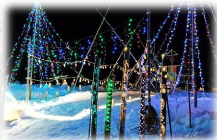
【福原地区】西原地区親睦会 雪まつり (いろりさんの寸劇・イルミネーション)(2月)