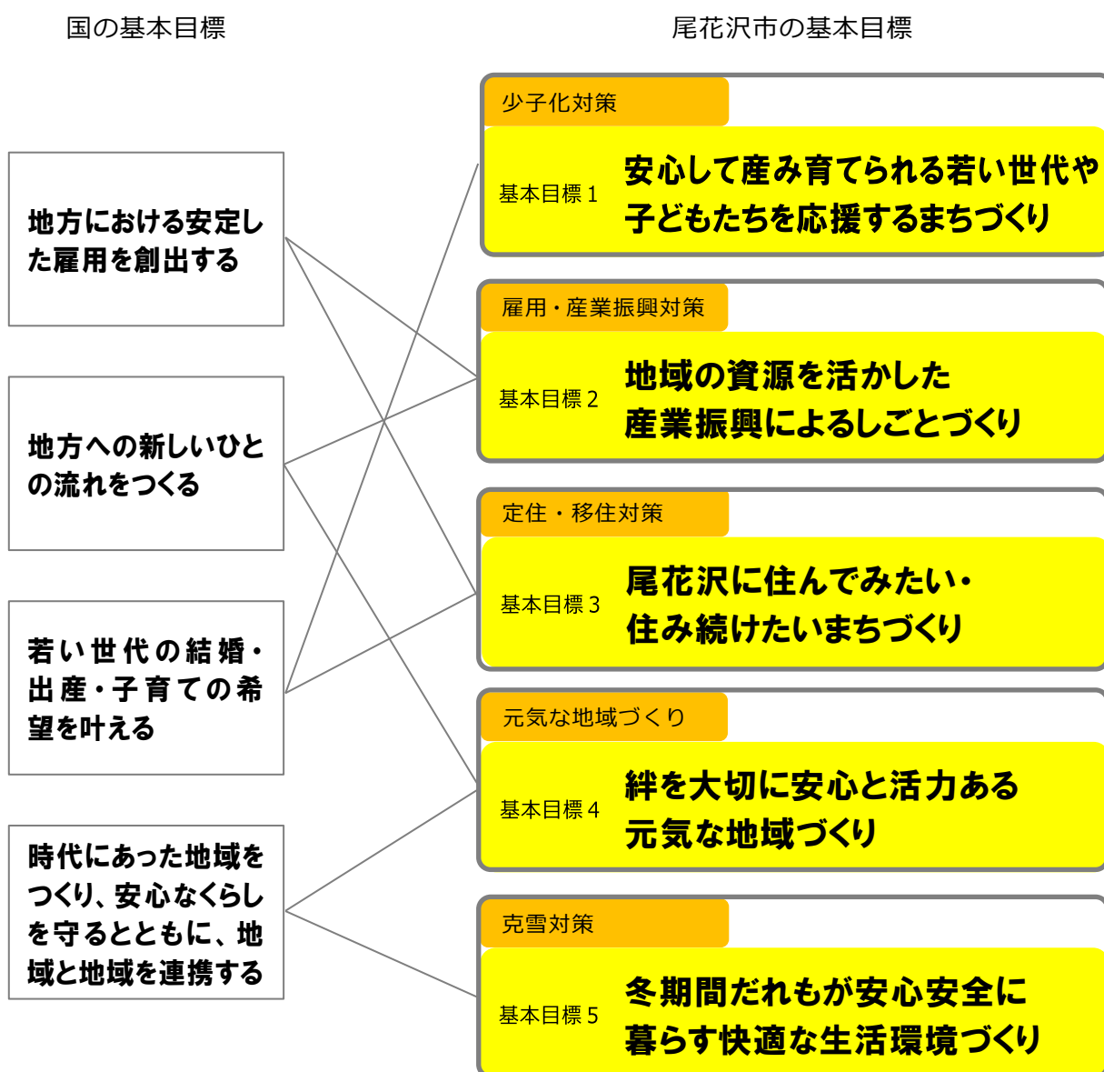
図3 尾花沢市総合戦略の基本目標

そこで尾花沢市では、国の設定する基本目標を踏まえつつ、本市の基本目標を5つ設定し、市民との協働による戦略を推進していきます。