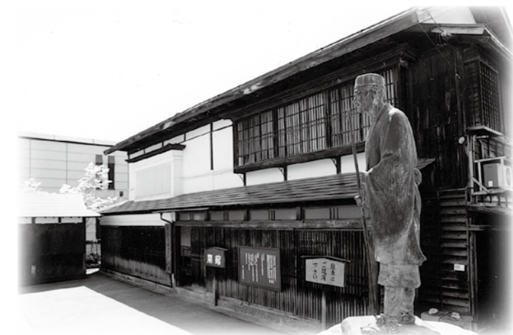
松尾芭蕉 10 泊のまち、尾花沢。芭蕉、清風歴史資料館には貴重な関連資料を展示。