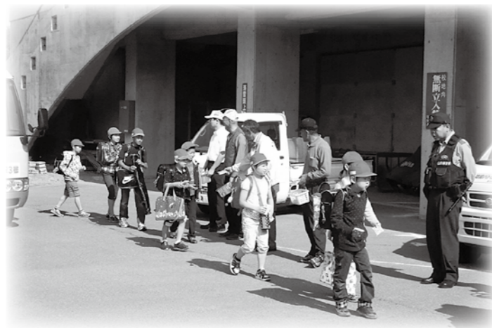
地域の子供は地域で育てる「さわやかあいさつ運動」