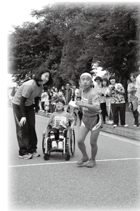
市内を縦断する「元気おばね『絆』駅伝」