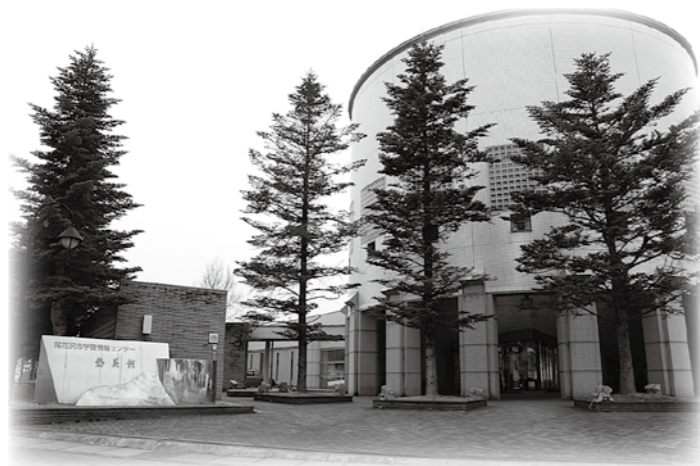
尾花沢市学習情報センター悠美館。幼児向けの図書も充実した図書館やハイビジョンホールを備える。