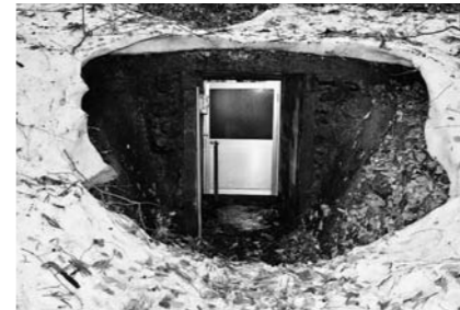
▼防空壕で甘みが増したサツマイモ