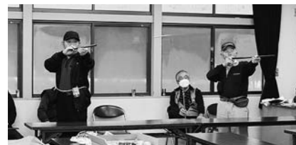
▲宮沢地区吹き矢教室