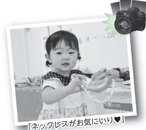
「ネックレスがお気に入り♡」