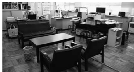
▲事務室(元職員室を利用)

これまで使用していた玉野地区公民館は、玉野地区生活改善センターとして昭和53年12月に建築されたもので、築43年となり、老朽化が進んでいました。 令和3年4月1日より、閉校となった玉野中学校校舎へ移転し、新たな玉野地区公民館としてオープンしました。 4月9日、地区の代表者等を招いてオープンセレモニーを開催。これからは玉野地区の地域づくりの拠点および地域と行政との橋渡しを行う機関として、玉野地区の皆さんの手助けを行ってまいります。