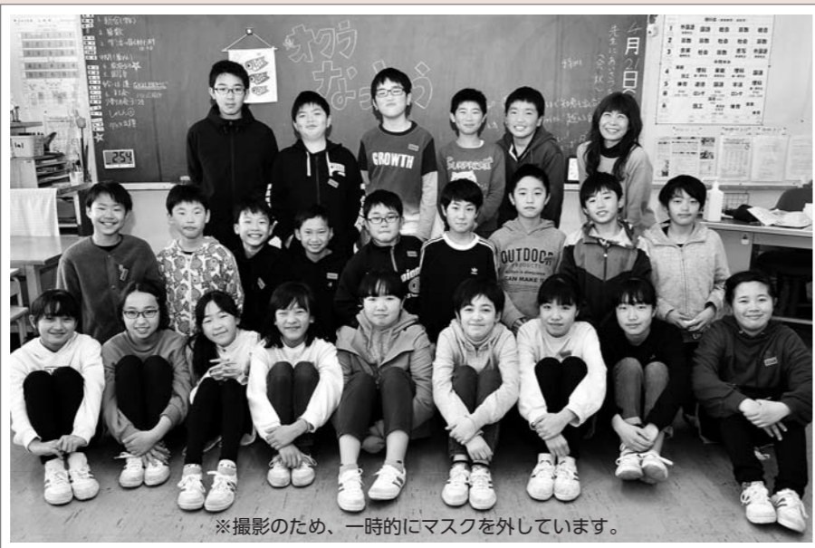
※撮影のため、一時的にマスクを外しています。