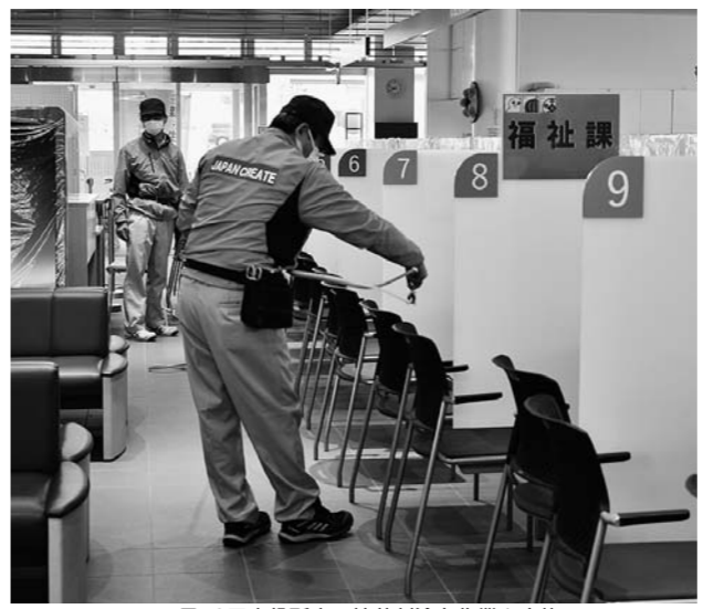
▲4月10日市役所内で抗菌剤塗布作業を実施。

4月10日、ジャパンクリエイト(株)が、地域貢献活動の一環として無償で市庁舎内でウイルス感染防止用の抗菌剤塗布作業を実施しました。薬剤には人体に無害な最新のものが使用され、受付窓口や椅子、トイレ等に、丁寧に薬剤を噴霧していただきました。 この作業により、皆様に安心して市役所を訪れていただけるような環境が整いました。ご厚意に感謝いたします。