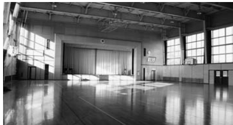
▲体育館(外の別玄関より出入りします)