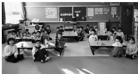
▲玉野放課後児童クラブも入っています。