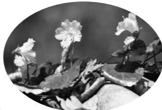
▲イワウチワは雪解け後の広葉樹林の中や岩場などに咲く日本固有種。御堂森の群生地では、登山道の両脇に似た淡いピンク色の小さな花が、枯れ葉の間からたくさん顔をのぞかせています。