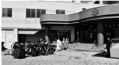
▲4月9日に行われたオープンセレモニー。

令和2年3月に閉校した旧玉野中学校校舎を活用するため、玉野地区公民館を移設。教室や体育館などの学校施設を有効活用し、地区民が集いやすく使いやすい施設になりました。