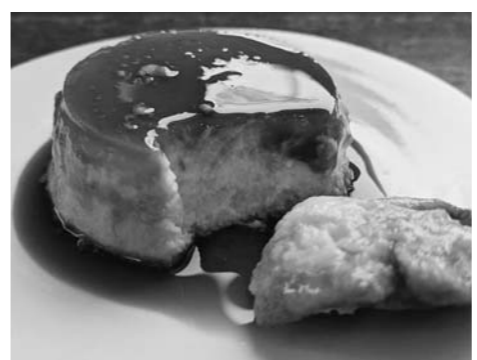
▲クリームチーズのなめらかプリンを食べながら徳良湖でのんびり過ごしませんか？

「白鳥たくさんいたよ」など話題を提供してくれる徳良湖。今年は築堤100周年のアニバーサリーですが、コロナ禍なのでみんなで集まるのお祝いは叶いません。ぜひ身近なご家族やご友人とそと徳良湖にお祝いしにいらしてください。 そしてグースカフェでゆっくりしてください。 徳良湖を一望できる窓際の席がおすす