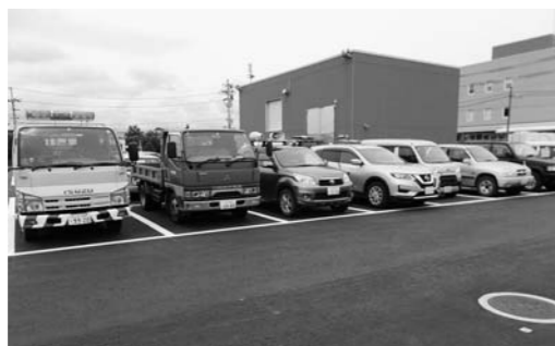
現在の公用車の駐車場

新しい鳥獣被害防止策を 問 追い払い花火や電気柵だけでは、被害の拡大を防げないため、市に対して新たな被害防止策を求める。 答 地域が一体となった活動を行う場合は、備品や消耗品の購入、日当などの支払いが受けられる『地域ぐるみで行う鳥獣被害対策支援事業』などの活用も含めて、積極的に支援していきたい。