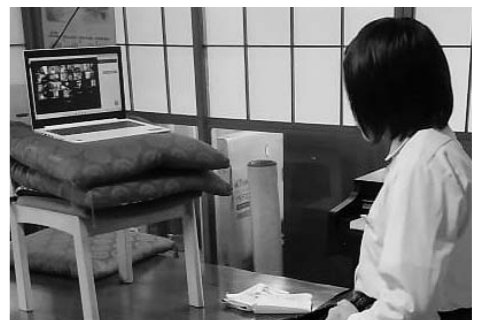
自宅でオンライン学習中

問 GIGAスクール構想の早期実現 問 文部科学省は各自治体に対して、1人1台端末と高速通信ネットワーク環境の一体的な整備目標を示していたが、学習環境の格差が露呈した。本市の現状と対応策はどのようなか。 答 この度の長期臨時休業においてもICTを活用し、子どもたちの学びを保障する国の計画前倒しの方針を踏まえ、準備を進めていきたい。 併せて、授業の中で有効