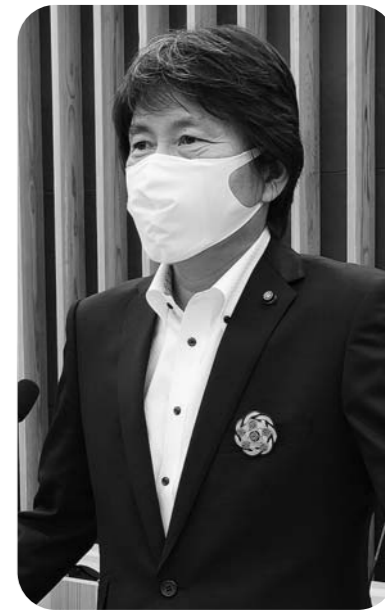
ほしかわ かおる 星川 薫 議員