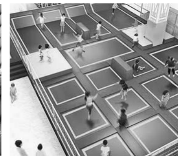
トランポリン(イメージ)

地籍調査の進捗状況と推進 問 現在、現地調査は終えていないが、登記が完了していない工区がどれほどあるのか。また、今後何年をめどに地籍調査の再開を計画しているか。 答 現在、12工区分が調査再開のめどは、令和6年度から着手できると考えている。 問 地籍調査を早期に再開するため、地籍調査係を復活させてはどうか。 答 現在の体制は決して充実とは言えないが、残っている12工区の認証・登記を頑張ることで進めていくので見守ってもらいたい。 行政サービスの向上 問 市民が窓口を訪れても、声を掛けないと職員が対応しない実態となっている。各課窓口会計年度任用職員を配置するな