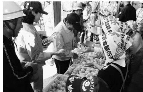
尾花沢市防災訓練(炊きだし訓練)

問 不良住宅除却促進事業補助制度の事前調査の申請件数と、不良判定で「不良住宅」の判定を受けた住宅の件数、補助金を交付された件数は何件か。 答 事前調査の申請件数6件、不良住宅の判定を受けた住宅2件、補助金交付2件になる。 問 申請期限が6月30日までと短期間の理由はなぜか。 答 危険な状態の空き家の早急な除却と、降雪前に解体完了を考慮しての期限だが、申請期限後も申請者に合わせた対応を考えていきたい。