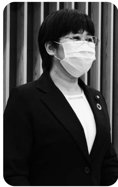
こせき えいこ 議員 小関 英子