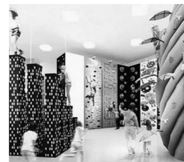
クライミング(イメージ)

問 屋内施設であればポルダリングやトランポリンなど、屋外ではスポーツフロアリングを採用し、移動式バスケットゴールの設置や自由に遊べる広場を計画的に整備してはどうか。 答 子どもたちへの環境整備を提供したいが、今抱えている問題をクリアし、都市計画マスタープランと併せて今やれることを精一杯やっていく。