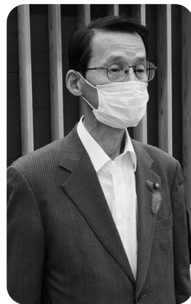
おくやま かわむ 議員

答 医療・福祉、物流・運送、小売りのほか、あらゆる業種について、国の方針に基づき、業種別の感染症予防対策ガイドラインが定められ、各業界を通じて公表・周知されている。