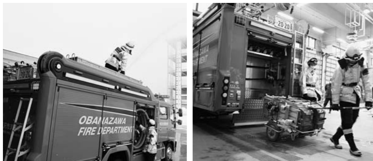
▲車両積載部に2,000ℓの水槽を搭載。車両上部には、高い場所や離れた場所への大量放水が行える放水銃も搭載されています。

このポンプ自動車は大石田分署に配備され、災害発生時には尾花沢市、大石田町のほか、各地の災害現場に出動し、消防活動を行います。