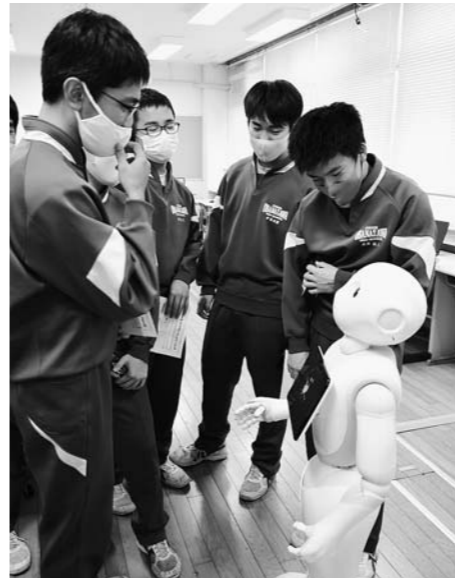
▲授業後、Pepperとの会話を楽しむ生徒たち

12月7日、尾花沢中学校3年技術科の授業で人型ロボットPepperを使用したプログラミングの学習が行われました。生徒がペアを組み、一方の生徒をPepperに紹介させるプログラムをパソコンで作成。「この人は吹奏楽部でした」など、Pepperが話す言葉を入力し、その言葉に合わせて、「おじぎょする」「手をあげる」などの動作指令を選択し、声の高さや話す速さを調節しました。Pepperは市に2台導入されており、市内の全小中学校で順次プログラミング教育が行われています。