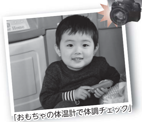
「おもちゃの体温計で体調チェック」