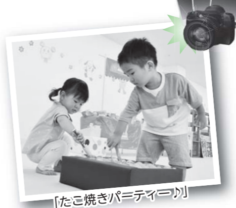
「たこ焼きパーティー」