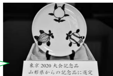
東京2020大会記念品 山形県からの記念品に選定