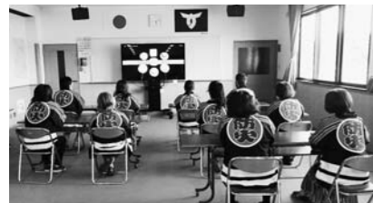
▲女性防火協力班連絡協議会役員会

これらの器材を活用し研修することで、市内全体の防火防災に対する意識の向上を図ります。