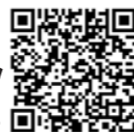
銀山温泉公式HPはこちら

※なお、荒天時または新型コロナウイルス感染症の状況により、イベントを中止・変更する場合があります。最新情報は銀山温泉公式HPをご確認ください。