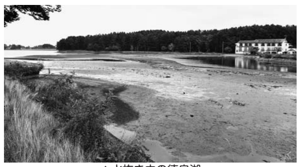
▲水抜き中の徳良湖