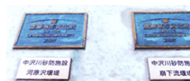
文責 宮沢地区歴史保存会 三浦幹雄