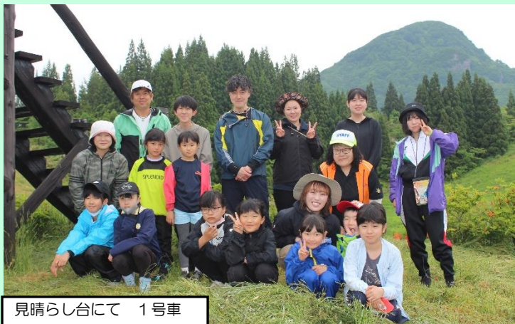
見晴らし台にて 1号車