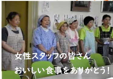
女性スタッフの皆さん おいしい食事をありがとう!