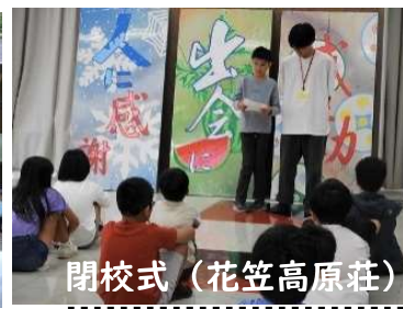
閉校式 (花笠高原荘)