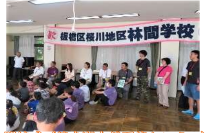
開校式 (徳良湖自然研修センター)