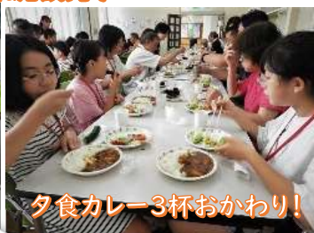
夕食カレー3杯おかわり!