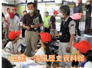
芭蕉・清風歴史資料館 たくぼん教室