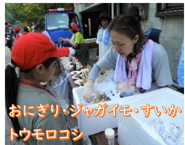
おにぎり・ジャガイモ・すいか トウモロコシ