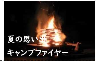
夏の思い出 キャンプファイヤー

4年ぶりに尾花沢林間学校が、7月28日(金)～30日(日)までの三日間行われ、大自然を体感した。板橋区青少年健全育成桜川地区委員会と板橋桜川地区・常盤地区交流事業実行委員会が協力し48回目。板橋桜川地区児童16名、高校生スタッフ、引率者18名が参加した。二日目は、常盤小学校5・6年生親子・スタッフ56名と一緒に御所山沢歩きやイワナ捕まえをし、交流を深めた。スタッフの温かいおもてなしは、子供たちの心に楽しい思い出として刻まれたことと思います。ありがとうございました。心より感謝申し上げます。