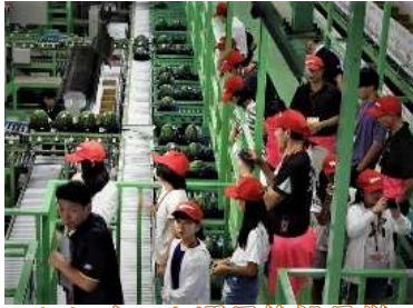
J A すいか選果施設見学